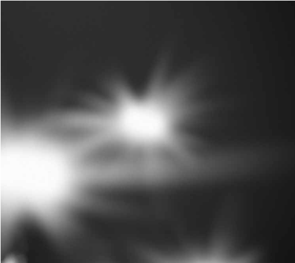
Rycina 3. Fotspsje – rozbłyśkiwanie światła w centrum pola, charakterystyczne dla chorób plamki