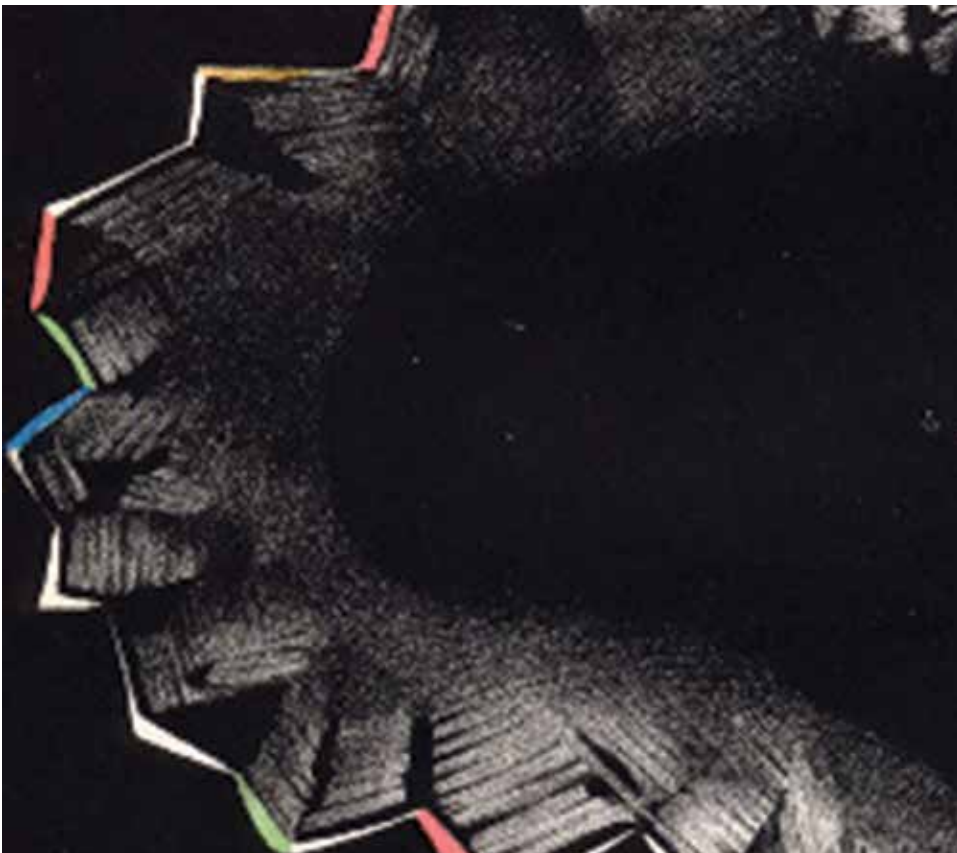
Rycina 4. Mroczek forteczny w migrenie